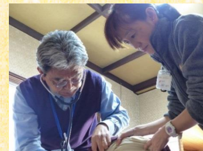
▲訪問診療にて。Drとあうんの呼吸で診療補助！